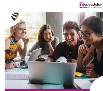
Keuzedeel K0210 Internationaal I: overbruggen (interculturele) diversiteit